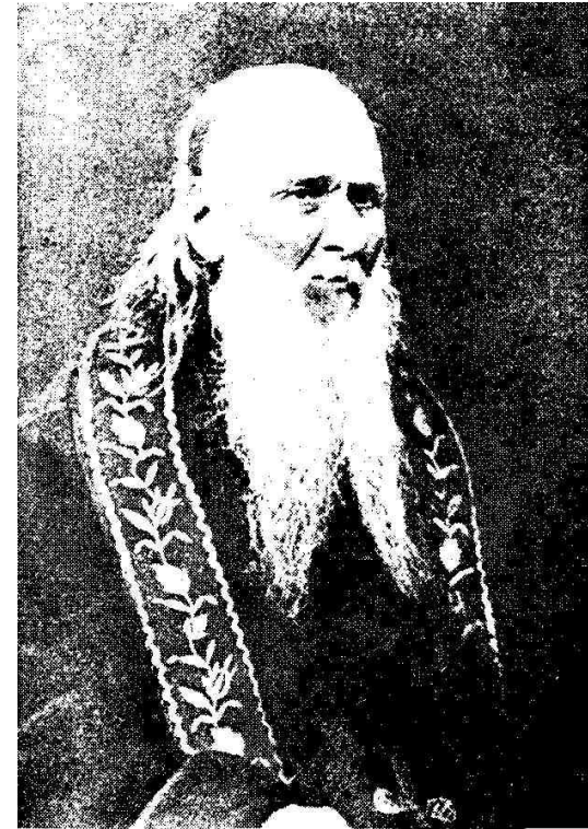
B i l d No. 6

Es muß übrigens bemerkt werden, daß diese Verschmelzung der Begriffe «russisch-national» und «russisch-orthodox» und diese fast abergläubische Überschätzung der äußeren Bräuche und Traditionen — für die erste und die vierte Geschichtsperiode Rußlands nicht charakteristisch erscheinen. Diese Verschmelzung steht vielmehr im tiefsten Zusammenhang mit der soeben erwähnten nationalen Katastrophe des Tatarenjoches, die zu Beginn der zweiten Periode einbrach. Das war die entsetzliche Zeit einer nationalen Überfremdung, Vergewaltigung, Knechtung und Erniedrigung; und die Reaktion auf diese Überfremdung war natürlich und spontan: man mußte sich zusammenschließen, man wollte sich distanzieren, einander erkennen und Treue einhalten. Da wurden Glaubensweise, Nationalität und äußere Lebensweise zur lebendigen Einheit. Man versenkte sich in den Glauben und der Glaube wurde zur Totalität . Man suchte sich als «rechtgläubig» vor dem Antlitz Gottes und national-treu dem Vaterland gegenüber zu erweisen; man litt; und man fand den Trost in der Kirche des Heilands. Auf diese Weise erhielt das Nationale den tiefen und heiligenden Unterbau des Christlich-Religiösen und das Christliche erfaßte das innere und das äußere Leben der Menschen. Inhaltlich