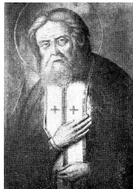
B i l d No. 5

3) Unter einem religiösen «Urphänomen» verstehe ich den konzentrierten Ausdruck des Glaubens, der gleichsam als lebendiger Knoten, alle Fäden der Glaubensweise und des religiösen Lebens in sich sammelt und wieder ausstrahlt. Zuweilen findet man solch ein Urphänomen in einem Wort , zuweilen in einem seelischen Zustand , zuweilen in einem äußeren rituellen Brauch . Da muß der Forscher «zugreifen», sich einfühlen, nachempfinden, schauen, verfolgen, bis er sich gleichsam inmitten eines Spinnwebes sieht, von wo aus ihm alles Grundsätzliche in dieser Religion natürlich, klar und verständlich erscheint, als hätte er selbst diesen Glauben übernommen. Dann erst darf er hoffen, daß «er's hat».